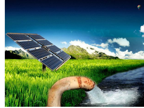
Solar pumping Water

Horta waa sax inay kaga faa'iideystaan jidkasta oo munaasib ku ah in looga faa'iideysto Cadceeda ama qoraxda ninba sida uu u yaqaano, laakiin baahida aan u baahanahay in looga faa'iideysto kaliya maaha in loo adeegsado waxyaabaha yar yarka ah. Maxaa yeelay waxaa looga faa'iideysan karaa dhamaan Horumarka dhankastaba dalka uu leeyahay, sida Soosaarista ceelasha Biyaha, Waraabinta Biyaha Beeraha, Korontada Guriga, isticmaalka dadka baadiyaha ku nool oo loo helayo dhamaan waxyaabo ku shaqeeya Solar-ka.